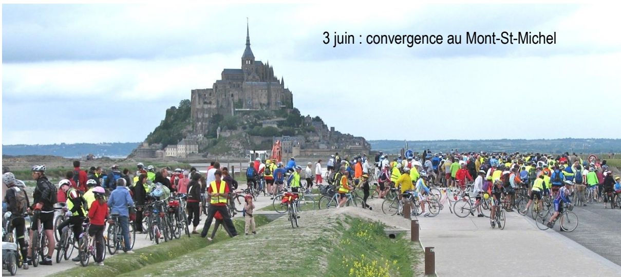
3 juin : convergence au Mont-St-Michel